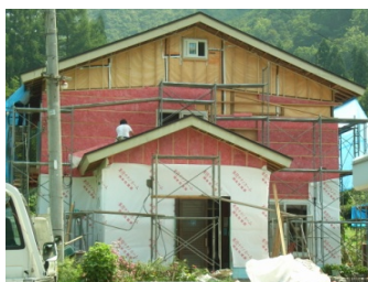
断熱材ですっぽり包む 断熱リフォーム

NPO 新木造住宅技術研究協議会 統括事務局 仙台市若林区かすみ町24-10 電話 022-781-1371 FAX 022-781-1372 E-mail aizawa@shinjukyo.gr.jp